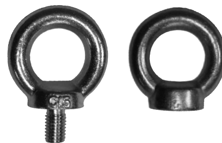
Mâle DIN 580